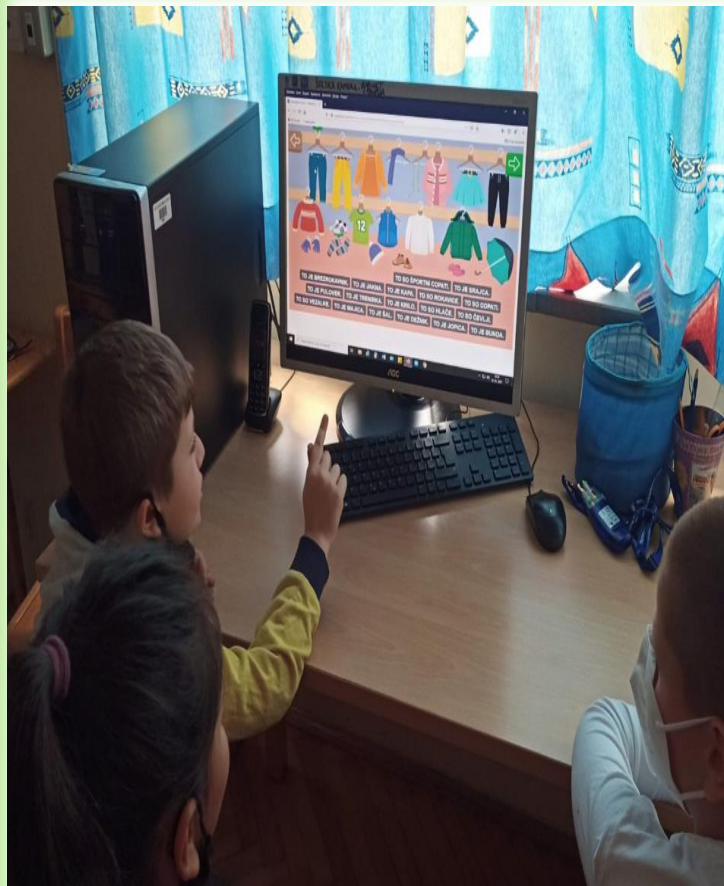
Slovenski jezik skozi igro (interaktivni slikovni slovar – oblačila)