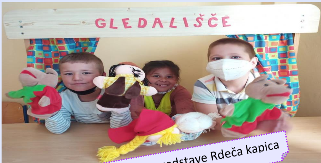
Uprizoritev lutkovne predstave Rdeča kapica