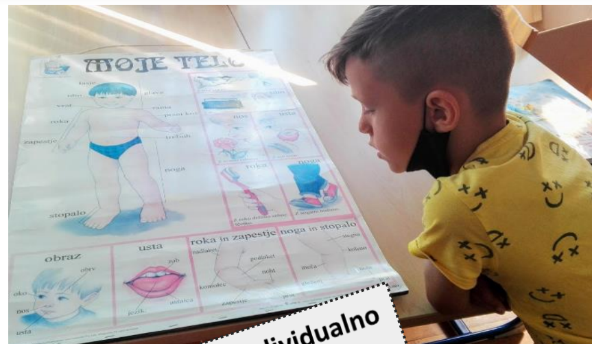
Učenje učenja - individualno (Človeško telo)