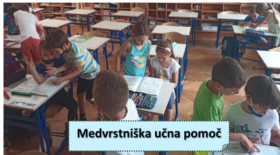
Medvrstniška učna pomoč