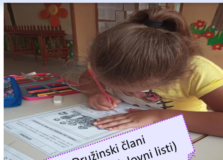
Družinski člani (Slika jezika, delovni listi)